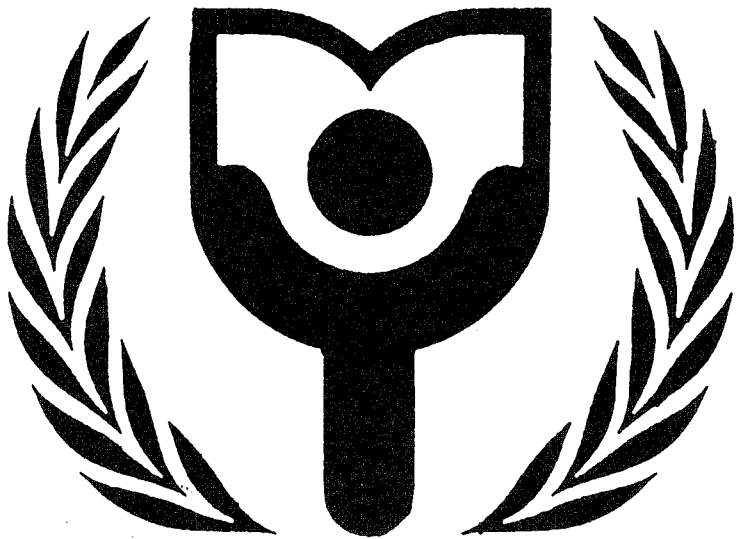
Symbolen för FNs internationella läskunnighetsår 1990